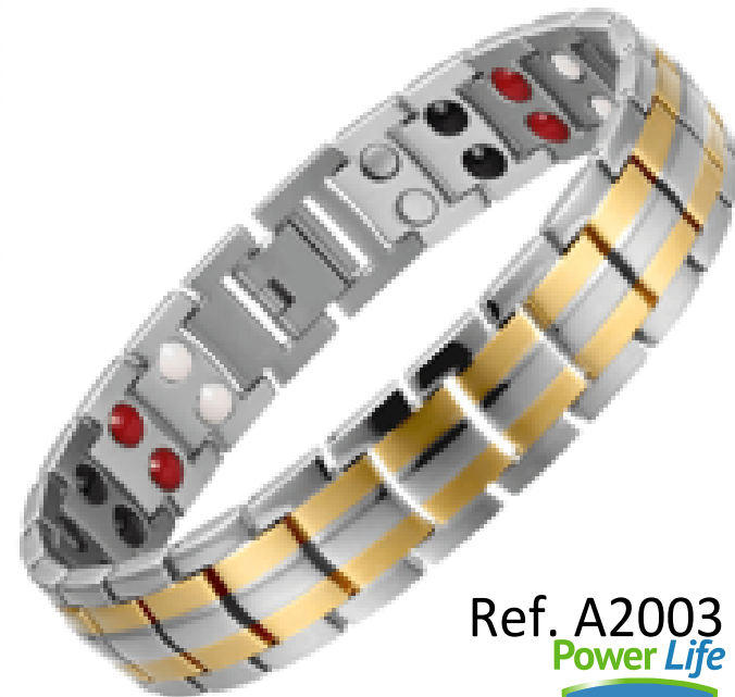
Ref. A2003 Power Life